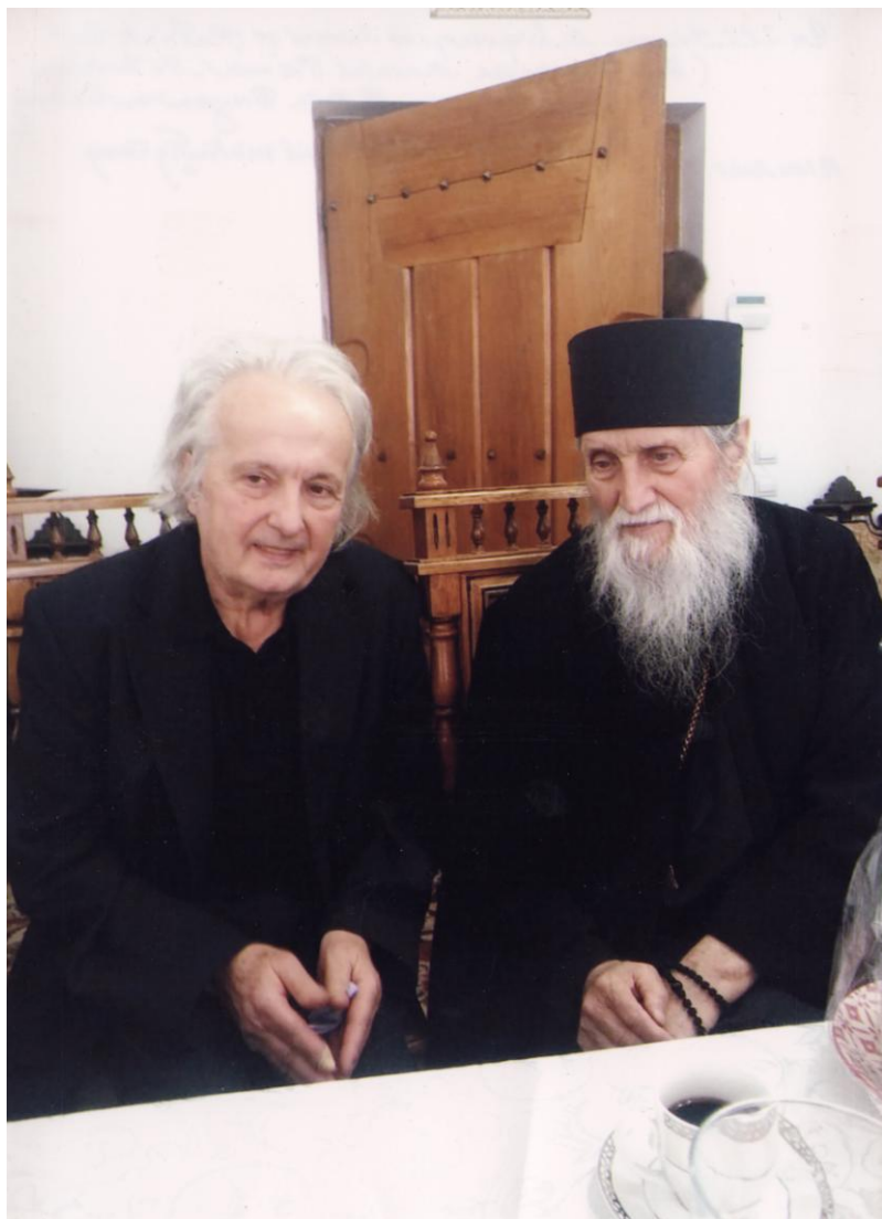
Cu Arhiepiscopul Pimen al Bucovinei (25 august 1929-20 mai 2020), la mănăstirea Dragomirna, 18 ianuarie 2020.